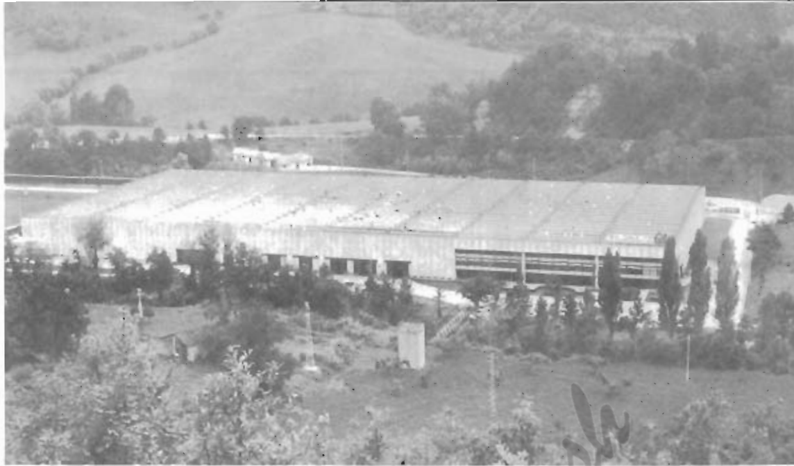
La fabbrica di elettrodomestici "Ariston" nei pressi di Comunanza uno dei pochi insediamenti industriali sorti nella zona.

un attento osservatore che non è stato fatto nulla o quasi nulla per risolvere tale situazione di abbandono.