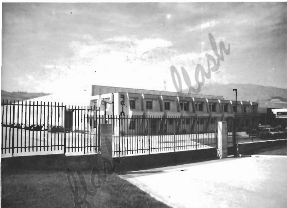
Uno stabilimento per la produzione di pannelli REIN in località Campolungo (sede della presidenza).

"Si tratta di un sistema rivoluzionario, sicuramente conveniente continua Cancelli - che permette di ottenere un manufatto capace di