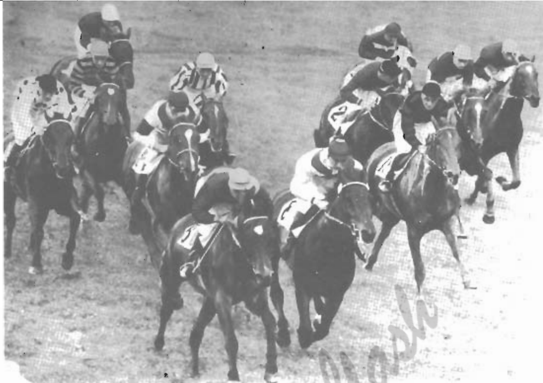
Le foto di questa pagina: gruppi di purosangue in corsa.

"Beh, questo è ancora troppo presto per dichiararlo - ma sorride con il fare di chi sa di avere l'asso nella manica ed aspetta solo il momento opportuno per calarlo - Posso affermare che dopo l'elezione di un consiglio di amministrazione questo provvederà a curare i necessari rapporti con le strutture pubbliche e private atti-