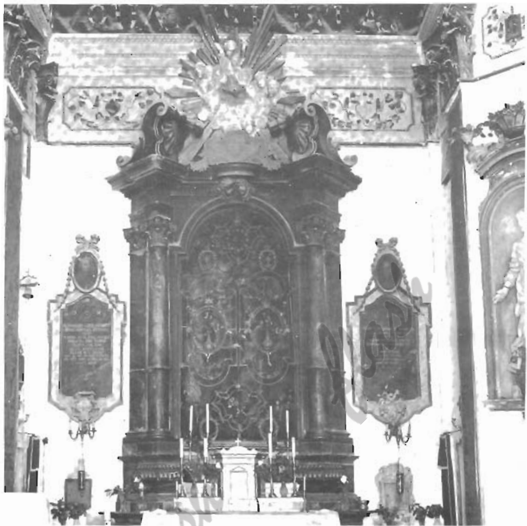
Villa Sgariglia in Campolungo. Tempietto dell'Assunta. La grata di protezione dell'immagine sull'altare fu eseguita da Francesco Tartufoli.

Una passeggiata per le vie cittadine sarebbe quindi oltremodo consigliabile, per un incontro ravvicinato con Francesco Tartufoli e con gli altri fabbri-ferraj del passato, forse di livello inferiore al Nostro e meno conosciuti, ma che hanno lavorato con la medesima profusione di fantasia, di competenza e di sudore per raggiungere un'unica finalità: rendere più bella Ascoli.