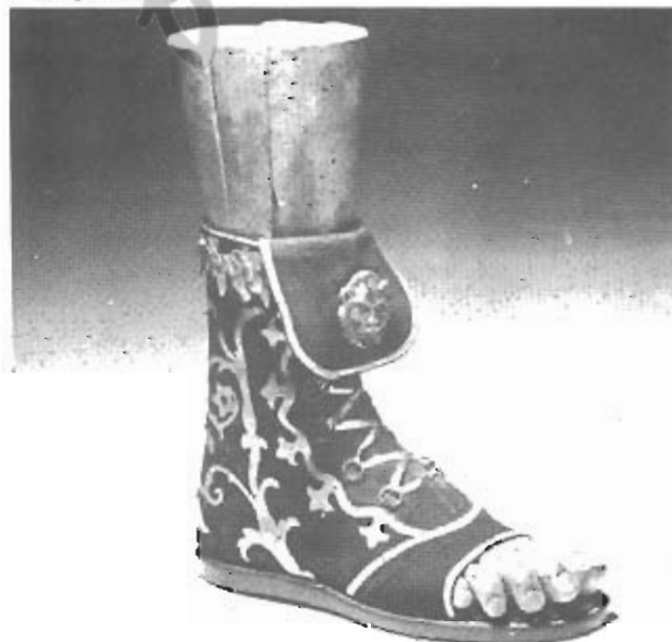
ROBERT TAYLOR - Quo Vadis? (1950) - Regia, Mervyn LeRoy - Costumi, Hirschel McCoy

dettaglio, quello della scarpa, che per molti anni il cinema aveva trascurato. Un tempo le dive si portavano le scarpe da casa, sotto gli abiti in costume le comparse nascondevano quel che gli faceva più comodo tanto più che le riprese, privilegiando i primi piani, non consentivano allo spettatore di accorgersi che sotto la tunica del prelado l'attore calzava un paio di scarpe da tennis o che la prima donna recitava in crinolina indossando delle comode ciabatte.