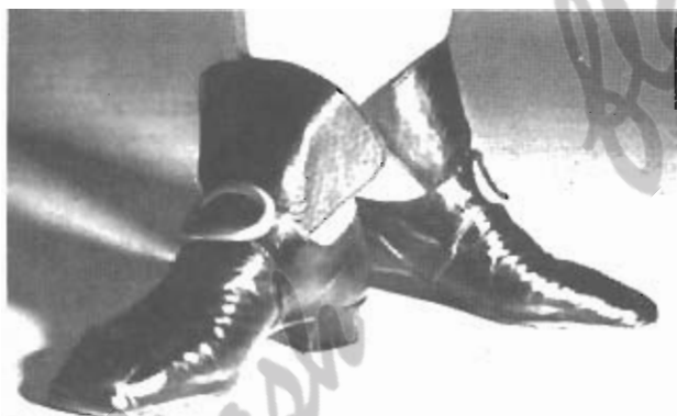
DONALD SUTHERLAND - Il Casanova (1976) - Regia, Federico Fellini - Costumi, Danilo Donati.