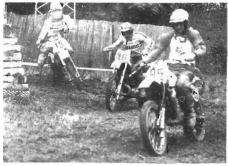
Perfetta ed impeccabile l'organizzazione della gara dovuta al Motoclub di Ascoli che si è dimostrato all'altezza della situazione.

Il crossodromo di Vallecchia ha retto benissimo al mal tempo, dato il consolidamento di tutto l'impianto ed ha creato i presupposti per la qualificazione per gare internazionali ad alto livello.