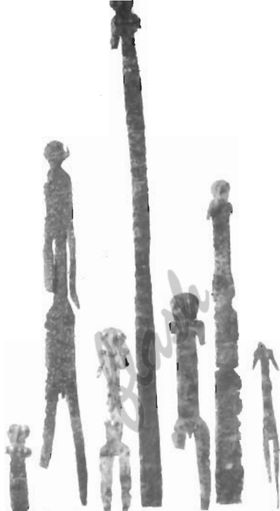
Ex-voto in laminae, da Montefortino di Arcevia. Museo Naz. delle Marche di Ancona (Le amorfie figurine umane, schiacciate in uno spazio pressoché bidimensionale, attestano la fine del creativo artigianato piceno)

i profitti, ma li spendevano per mantenere in città gli alti standard di vita di una società completamente romanizzata e sostanzialmente urbana. La città era diventata ormai la principale, se non la sola, spinta propulsiva ad ogni attività di lavoro (artigianato, servizi, mercato), esercitando conseguentemente una notevole attrazione sulle popolazioni rurali. Lo spopolamento della campagna rese la società accidentata, fino alle riforme agricole di Augusto, le quali indussero un certo riassetto. Con Augusto infatti si instaurarono condizioni di cultura e prosperità abbastanza equamente distribuite, ma il glorioso spirito creativo degli artigiani piceni (si pensi alla splendida situla di Offida, ora nel British Museum di Londra) finì con l'essere mortificato e appiattito sulle esigenze di un povero mercato periferico (si considerino i rozzi ornamenti femminili di Rotella e gli oggetti provenienti da Morsampietro Morico, gli uni e gli altri nel Museo Archeol. di Ascoli), in quanto ormai aristocratici e borghesi facevano venire ciò di cui avevano bisogno (statue, utensili, gioielli, indumenti) direttamente da Roma.