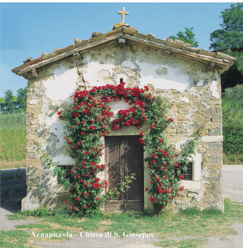
Venapiccola - Chiesa di S. Giuseppe